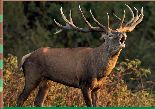
Rothirsche „röhren“ lautstark in der Brunftzeit.

Jedes Wildtier kann verschiedene Laute von sich geben. Sie hören sich unterschiedlich an, je nachdem, was sie damit ausdrücken wollen. Es gibt Laute, mit denen sie sich verständigen, Balzlaute, mit denen sie Partner suchen, und Klagelaute, die sie von sich geben, wenn sie verletzt sind oder Schmerzen haben.