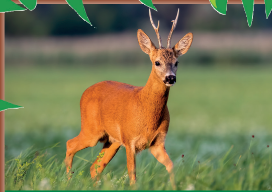
Rehe „bellen“, wenn sie eine Gefahr vermuten.