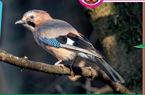
Eichelhäher sind wahre Stimmkünstler.