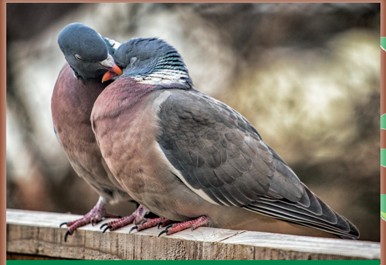
Ringeltauben haben einen dumpfen Gesang.