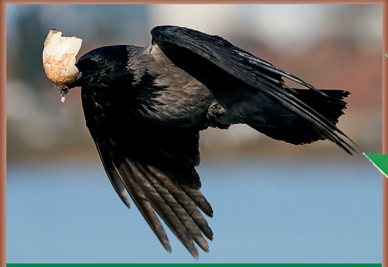
Nebelkrähen krächzen rau und heiser.