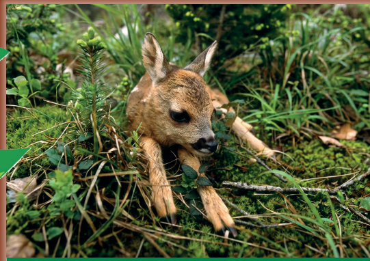
Rehkitze „fiepen“ leise nach ihrer Mutter.