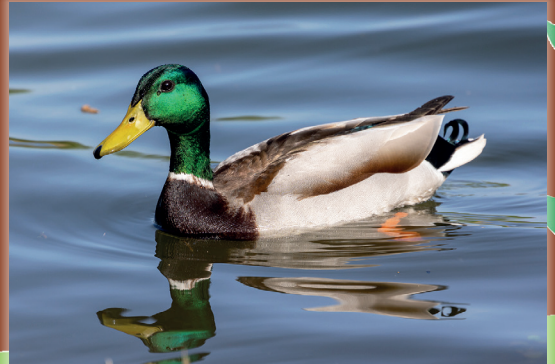
Das Quaken der Enten kennt ihr bestimmt.