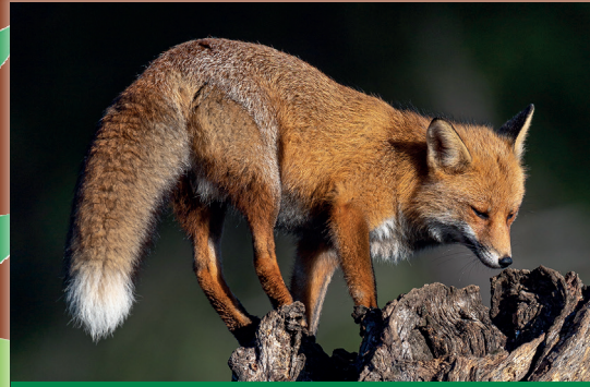
Fuchsrüden versuchen, mit heiserem „Bellen“ die Fähen (Weibchen) anzulocken.

Mehr Infos zum Thema Jagd und über Führungen im Schloss Mageregg erhaltet ihr bei der Kärntner Jägerschaft, Gerald Eberl, Telefon: 0463/ 51 14 69 - 12